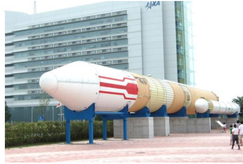
JAXAで宇宙を勉強しよう!

参加ご希望の方は、3月31日までに34-7392までお電話ください。なお、毎回満員のため、先着順となりますのでご了承ください。