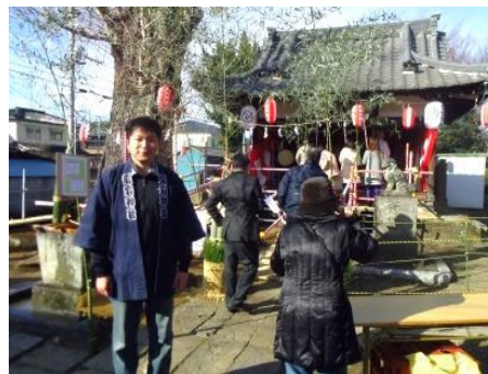
自治会のお手伝い

【家族】妻と愛犬 【好きな食べ物】牡蠣・果物 【尊敬する人】イチロー選手 【好きな言葉】あきらめたらそこで試合終了だよ 【趣味】読書(村上春樹・三浦綾子) 【子どものころの夢】電車の運転手 【意外な一面】社交ダンスをならっています