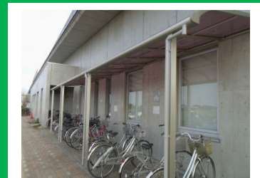
カルスタ駐輪場屋根設置