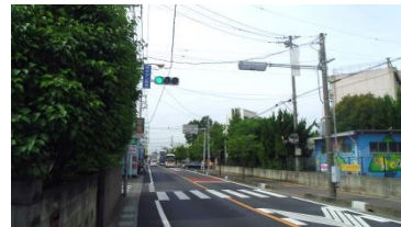
杉小・杉中間の信号機